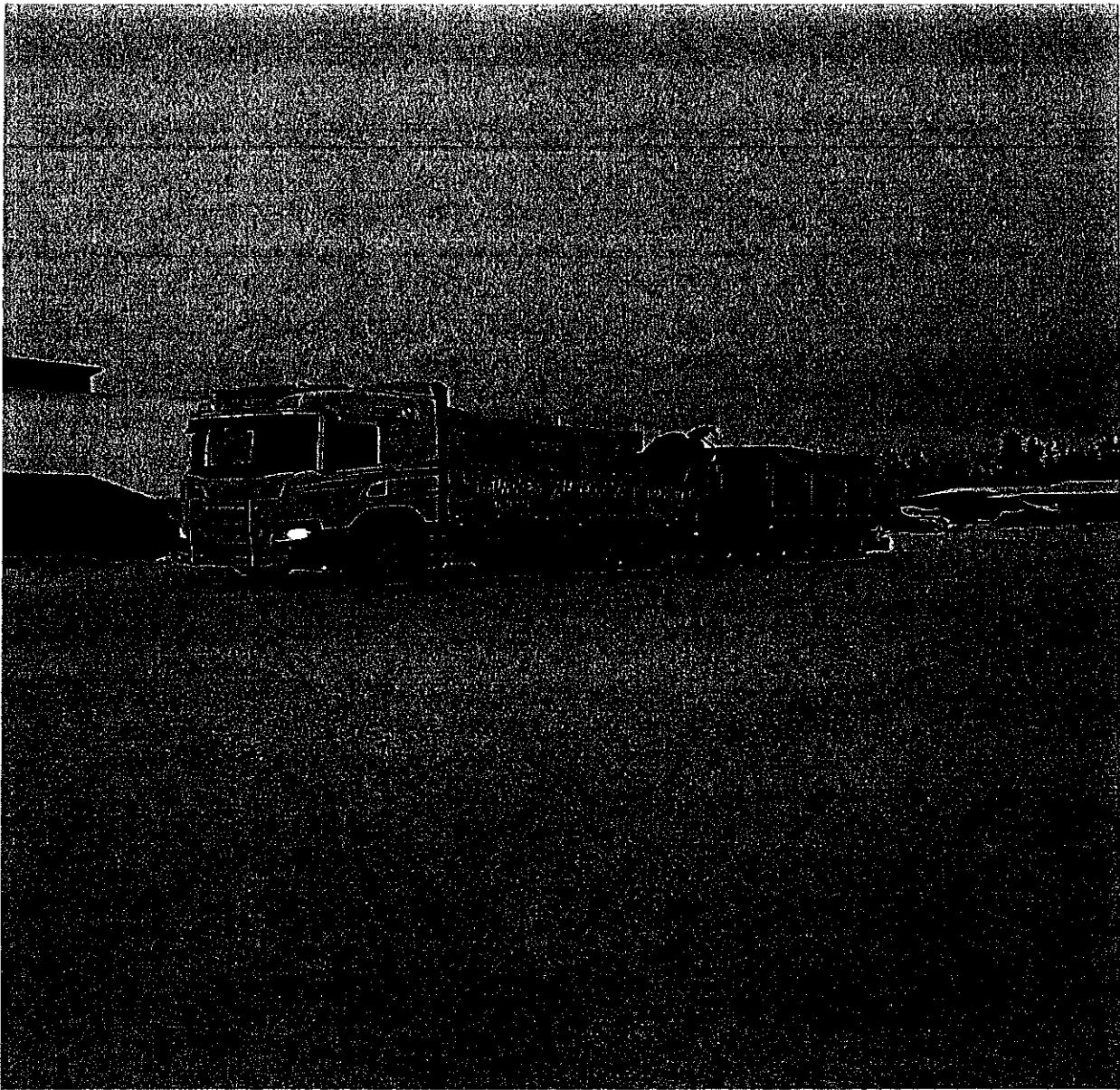
Lastebil med henger opplastet med hon