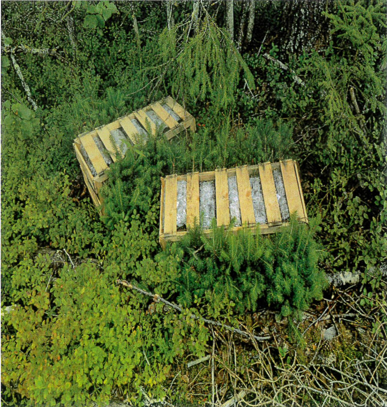
Planter på tur ut i terreng

Det er også gjort grøfterensk med 2985 lm. Til tross for mangel på arbeidskraft til planting ble det nesten plantet 70 000 planter i 2021. Det var litt under det som var planlagt, og vi har et etterslep som vi kommer til å ta igjen i 2022